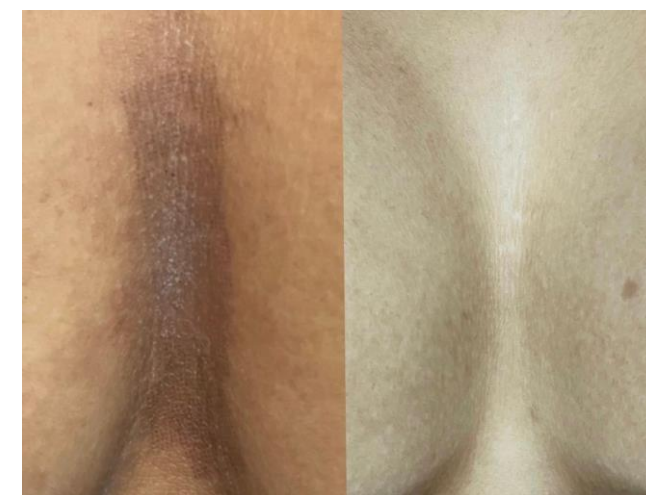
Después 5 sesiones

Repetir una vez a la semana 4 sesiones mínimo